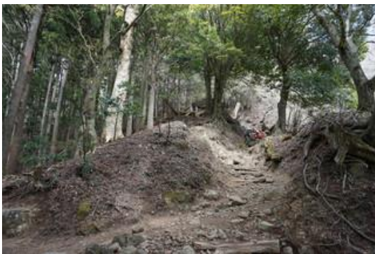
12 丁目 新緑の中辛い登りが続きます。