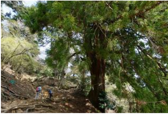
8 丁目の夫婦杉は変わらず立派です。