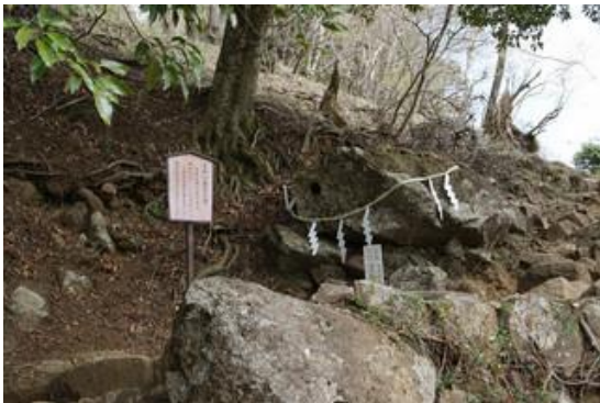
15 丁目 天狗の鼻突岩はどうして丸い穴が開いたのでしょうか。