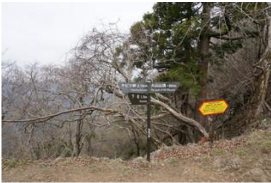
25 丁目 ヤビツ峠からの道と合流します。