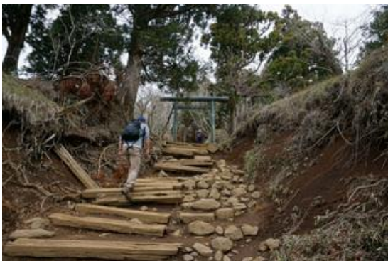
27 丁目 山頂の鳥居が見えました。