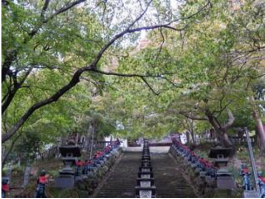
石段を下から見上げると緑一色です。