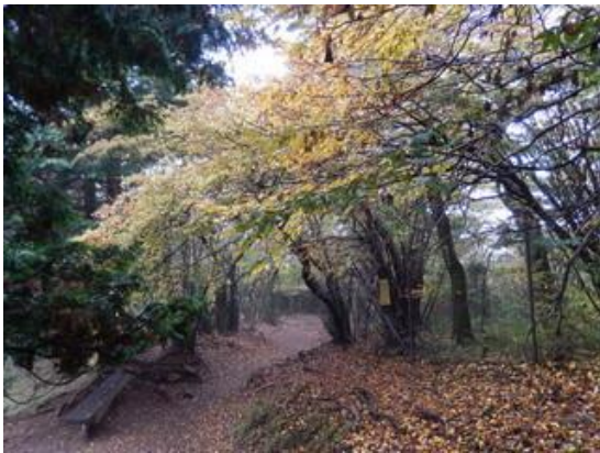
標高 1000mを下がると、紅葉が最盛期を迎えていました。