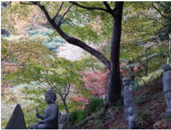
石段の途中から周囲を見渡すと、ちらほらと色づく木々が望めます。