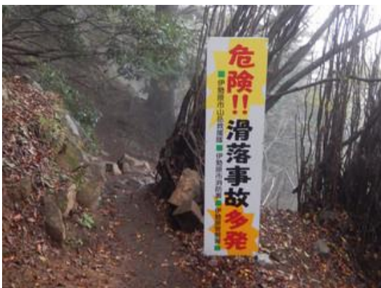
この尾根には危険な鎖場が 2 カ所あり、注意を呼び掛けています。