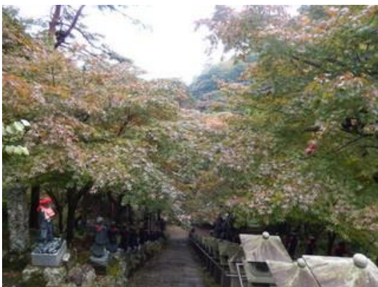
登り切って上から見ると、日の当たるわずかな部分の色が変わっています。