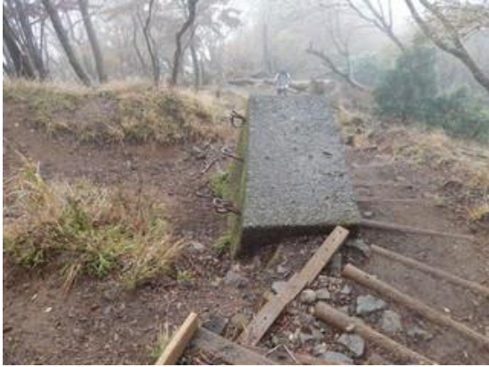
途中にある謎の構造物