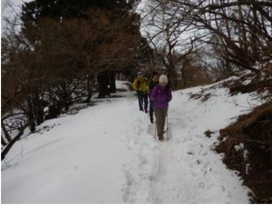
11:28 20丁目付近 積雪は20 cm位になりましたが凍結していません。