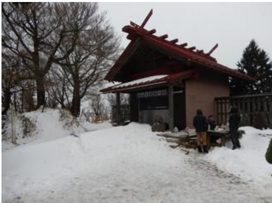
山頂トイレは使用できます。