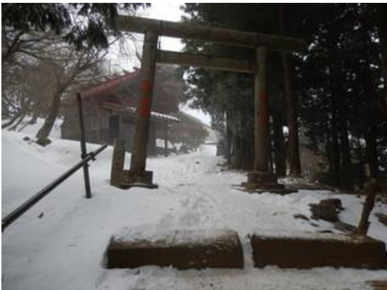
11:55 ようやく山頂に到着しました。