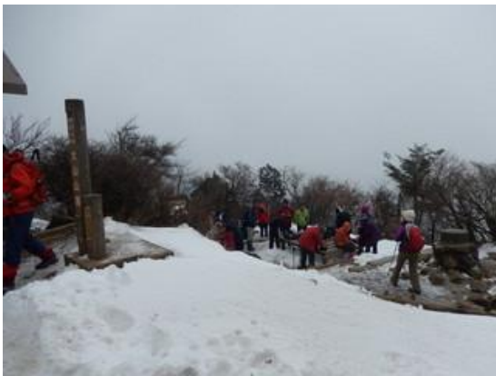
山頂の積雪は深い所で 40 cm位あり、風が強く大変に寒いです。