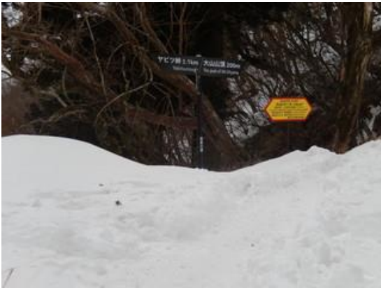
11:44 25丁目 ヤビツ峠からの合流部