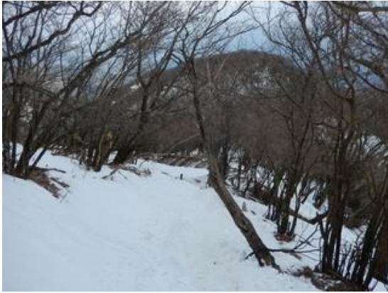
12:55 雷の峰を下って見晴台方面から日向へ下山します。