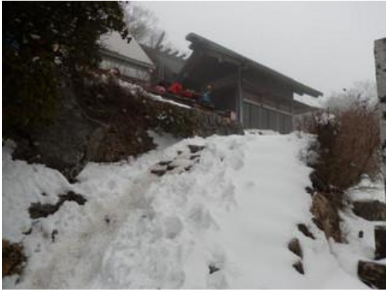
11:56 本社前の石段も雪の下です。