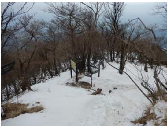
13:03 七沢への分岐。雷の峰の方が本坂より雪が深いです。