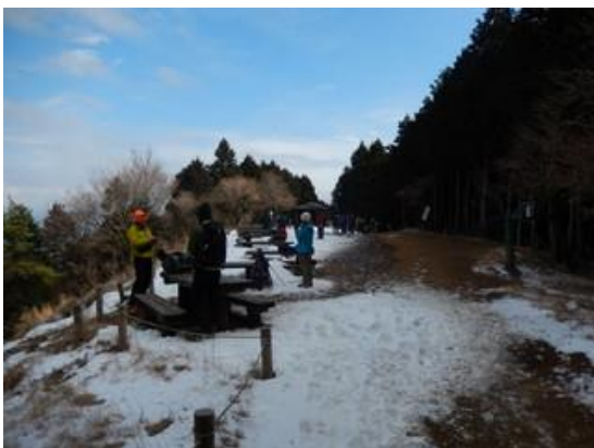
13:50 見晴台に到着。ここでは雪は少なかったですが、この先九十九曲がりの森の中にも雪は残っていました。